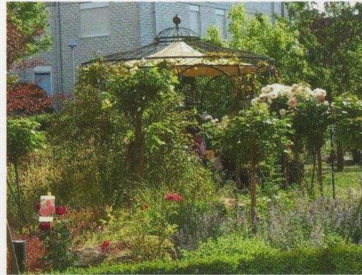
Rosenpavillon Garten Haus 1