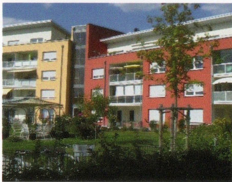
Haus Ginkgo 1

Die Eigentümer der 42 barrierefreien Wohnungen mit 49 bis 91qm - überwiegend 2-Zimmer-Wohnungen - sind entweder Ginkgo-Vereinsmitglieder oder die Wohnungsgenossenschaft Ginkgo Langen e.G.