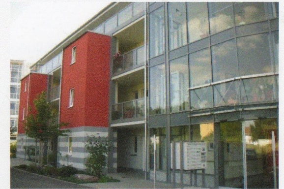
Haus 1 (Eingangsbereich)