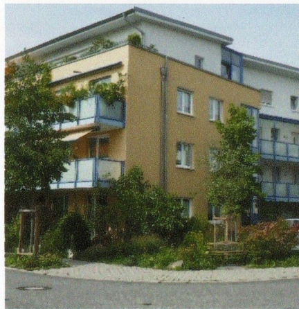
Haus Ginkgo 2

In beiden Häusern wohnen Paare und Einzelpersonen in eigenen Wohnungen und genießen das Miteinander der Wohngemeinschaft in sportlichen, kulturellen und geselligen Aktivitäten im Haus oder außerhalb.